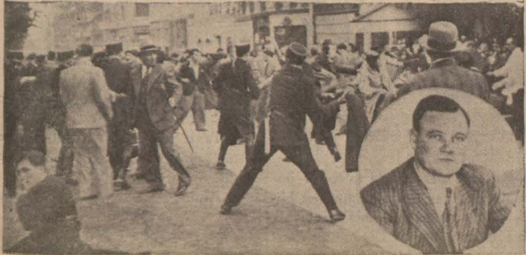
Fransadaki raşistlerle Komünistlerin bundan evvel yaptıkları sokak muharebelerinden bir intiba, ve Komünistlerin lideri Toretz

Komünistlerin vücuda getirdikleri otuza yakın barikattan sonuncusu asker ve polis kıt'aları tarafından sabahın yedisinde zaptedildi